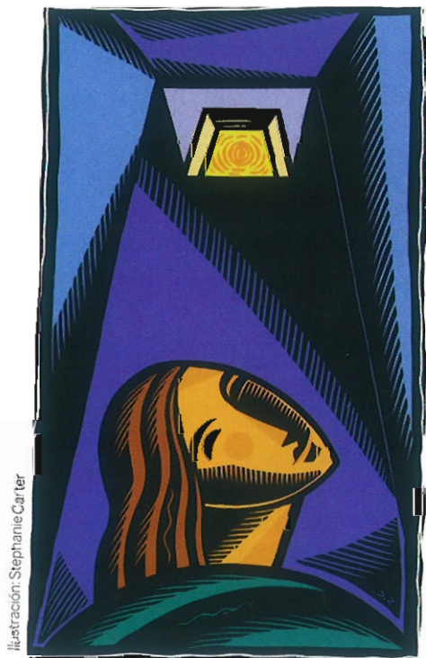
Ilustración: Stephanie Carter

Si desea saber más sobre la santa: http://en.wikipedia.org/wiki/Saint_Dymphna www.mariavallejonaegera.com